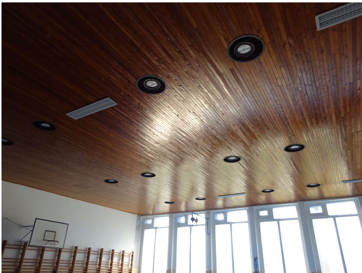
Ilustrační snímek – tělocvična